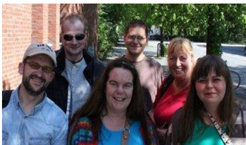
Starfsmenn NsN á ferðalagi í Noregi

NsN verkefnið er gæðaeftirlit sem m.a. felur í sér að rannsaka aðstæður geðsjúkra innan